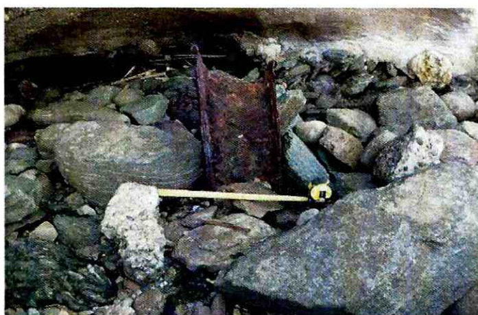
Figura 3: Rasgo NCA-2

En cuanto al Rasgo NCA-2 (Figura 3), tal como se expresó en párrafos anteriores, coincide con los materiales constructivos empleados por la industria siderúrgica que existió en el lugar durante el S. XX, por lo que es factible suponer su correspondencia a este periodo de ocupación del Monumento Histórico, mientras que el Rasgo NCA-3 (Figura 4), dado lo acotado de su registro y el amplio espectro de uso de ladrillos en el continuo ocupacional del fuerte, no es factible establecer alguna relación temporal.