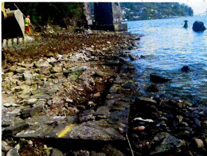
Figura 2: Rasgo Estructural NCA-1.

En cuanto al Rasgo NCA-2 (Figura 3), tal como se expresó en párrafos anteriores, coincide con los materiales constructivos empleados por la industria siderúrgica que existió en el lugar durante el S. XX, por lo que es factible suponer su correspondencia a este periodo de ocupación del Monumento Histórico, mientras que el Rasgo NCA-3 (Figura 4), dado lo acotado de su registro y el amplio espectro de uso de ladrillos en el continuo ocupacional del fuerte, no es factible establecer alguna relación temporal.