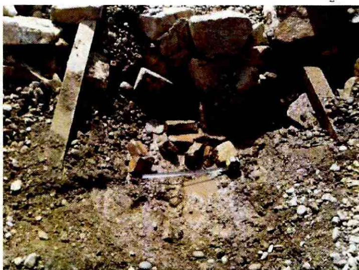
Figura 4: Rasgo NCA-3